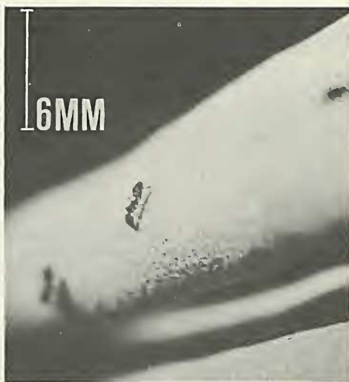
Figura 3 Formigas Azteca sorvendo néctar da inflorescência feminina.